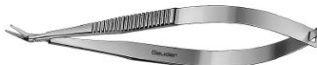
G-19575 SCISSORS bent, blunt-blunt 10 cm

Dotyczy – pakiet nr 6 poz. 18 - Czy Zamawiający dopuszcza do dostawy narzędzie chirurgiczne wykonane z odpornej na odkształcenia / uszkodzenia mechaniczne stali nierdzewnej z podwójną powłoką chromową o długości całkowitej 100 mm o kodzie G-19575 lub G-19585 (p. rys.)