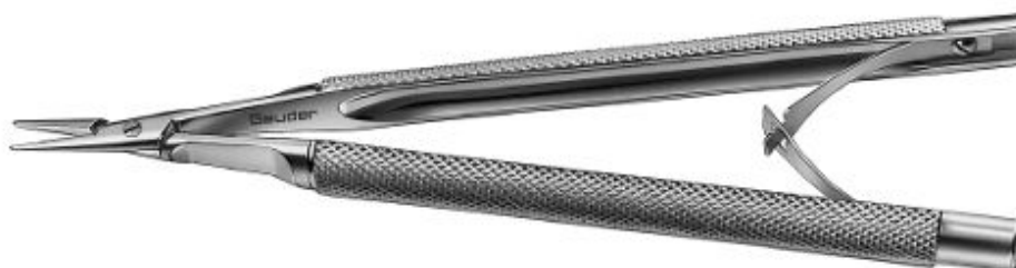
G-17580 CASTROVIEJO NEEDLE HOLDER straight, without lock handle 10.0 mm total length 135 mm

Dotyczy – pakiet nr 6 poz. 16 - Czy Zamawiający dopuszcza do dostawy narzędzie chirurgiczne wykonane z odpornej na odkształcenia / uszkodzenia mechaniczne stali nierdzewnej z podwójną powłoką chromową o długości całkowitej 135 mm o kodzie G-17580 (p. rys.)