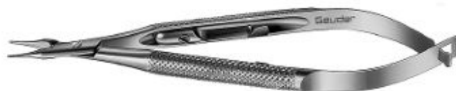
G-32261 BARRAQUER-TROUTMAN NEEDLE HOLDER straight, with lock handle 6.0 mm total length 100 mm

Dotyczy – pakiet nr 6 poz. 17 - Czy Zamawiający dopuszcza do dostawy narzędzie chirurgiczne wykonane z odpornej na odkształcenia / uszkodzenia mechaniczne stali nierdzewnej z podwójną powłoką chromową o długości całkowitej 100 mm o kodzie G-32261 (p. rys.)