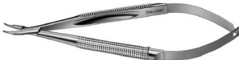
G-17500 BARRAQUER NEEDLE HOLDER curved, without lock jaw 0.55 mm handle 8.0 mm total length 120 mm

Dotyczy – pakiet nr 6 poz. 23 - Czy Zamawiający dopuszcza do dostawy narzędzie chirurgiczne wykonane z odpornej na odkształcenia / uszkodzenia mechaniczne stali nierdzewnej z podwójną powłoką chromową o długości całkowitej 120 mm o kodzie G-17500 (p. rys.)