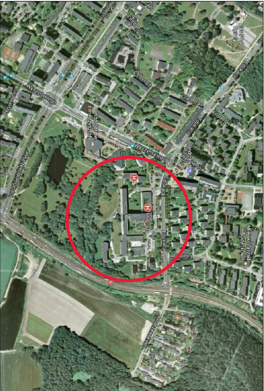
ZAŁĄCZNIK NR 14 DO PROGRAMU FUNKCYJNALNO-UŻYTKOWEGO

Inwestor: Wojewódzki Szpital Specjalistyczny Megrez Sp. z o.o. 43-100 Tychy ul. Edukacji 102